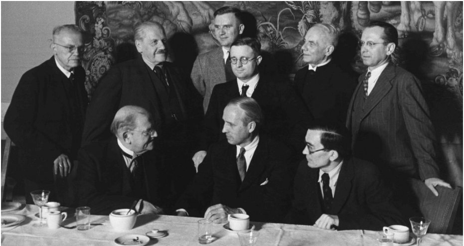
Gründung der Münchner GCJZ am 9. Juli 1948

Zum Abschluss der Tagung präsentieren die Studierenden unter dem Titel „München und der jüdisch-christliche Dialog nach der Schoa“ die Ergebnisse, die sie im Rahmen dieses Seminars mit Dozentin Julia Schneidawind während des Sommersemesters erarbeitet haben.